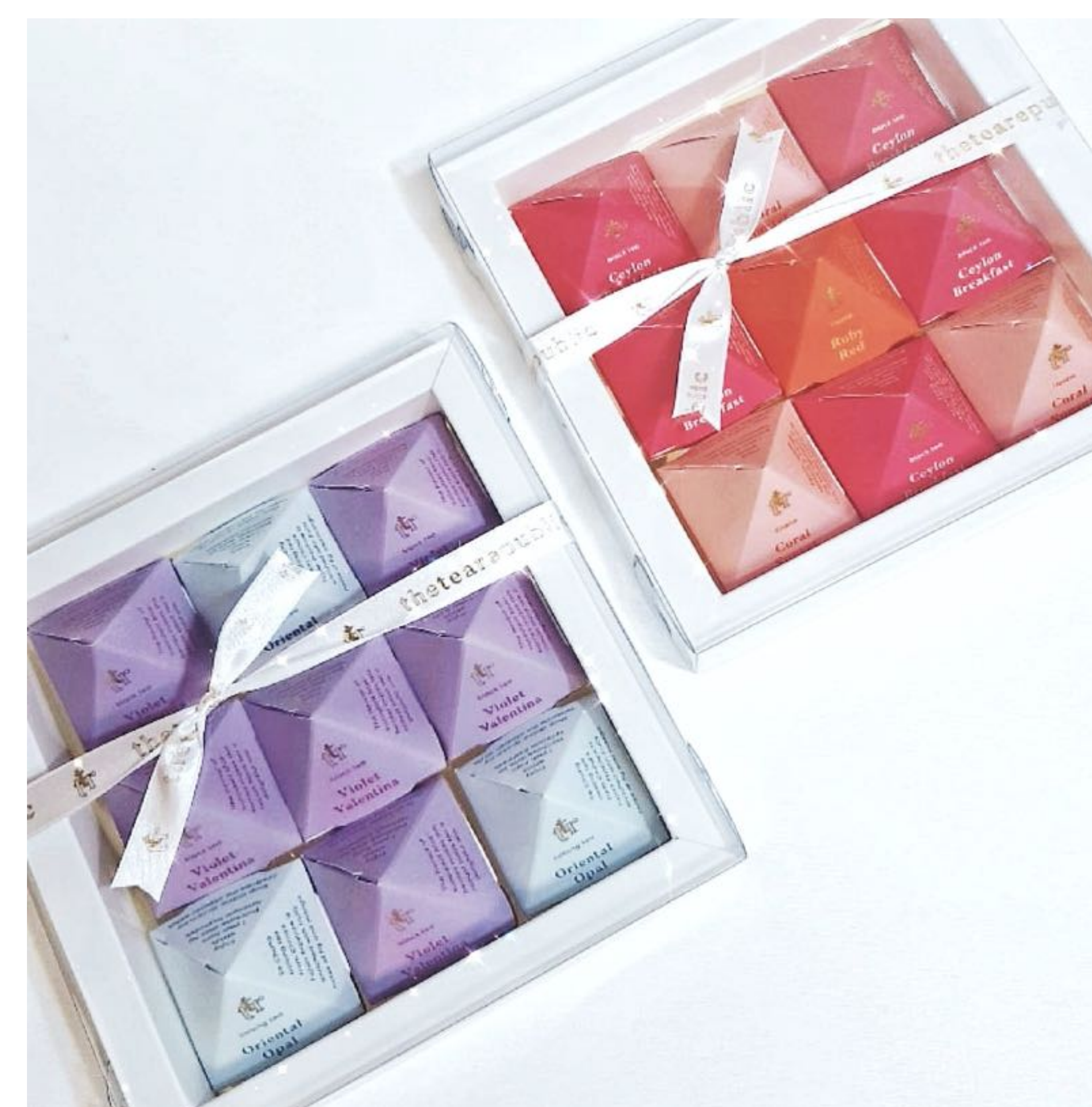
Ukázka dárkového balení