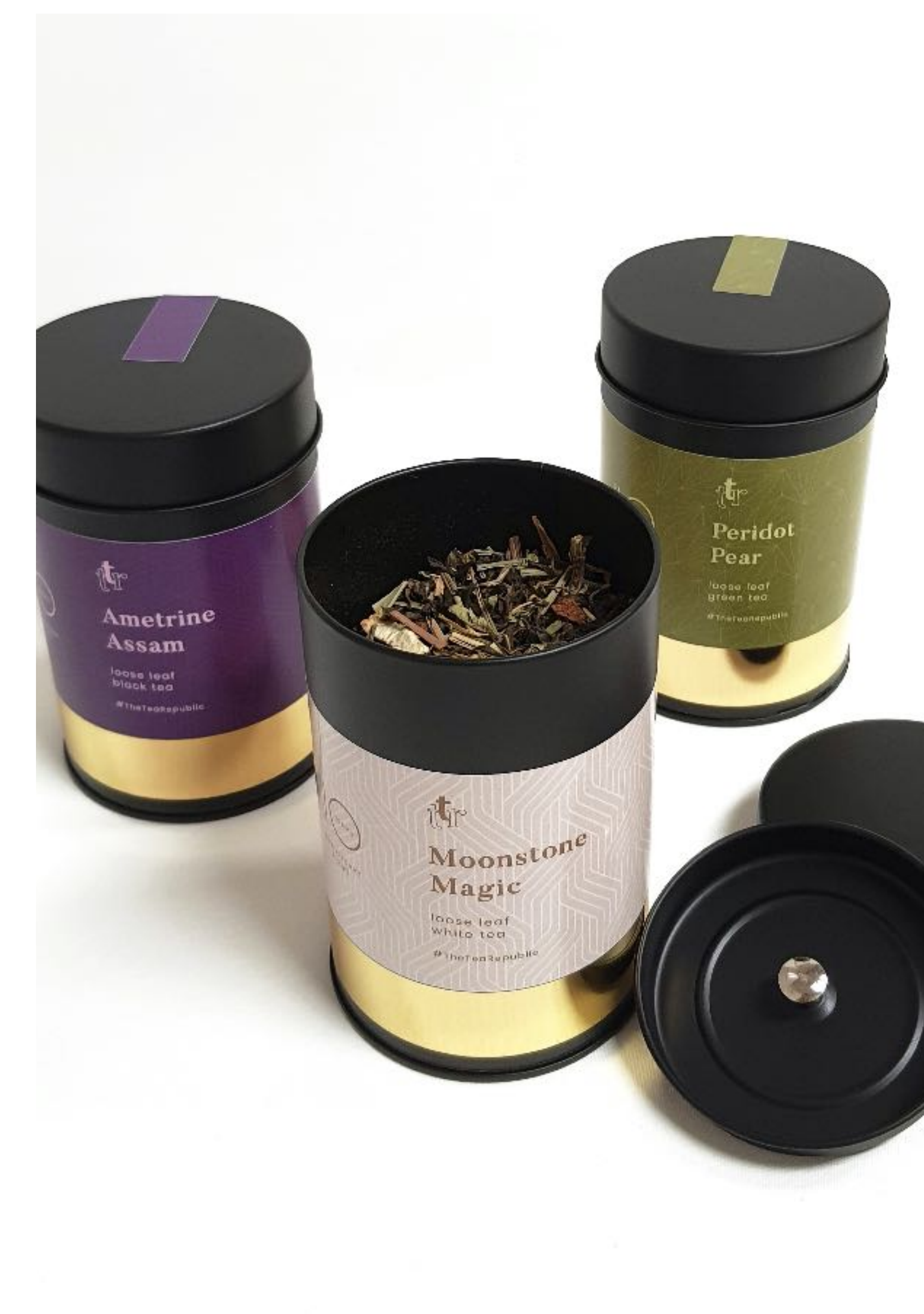
Sypaný čaj dóza, 75g