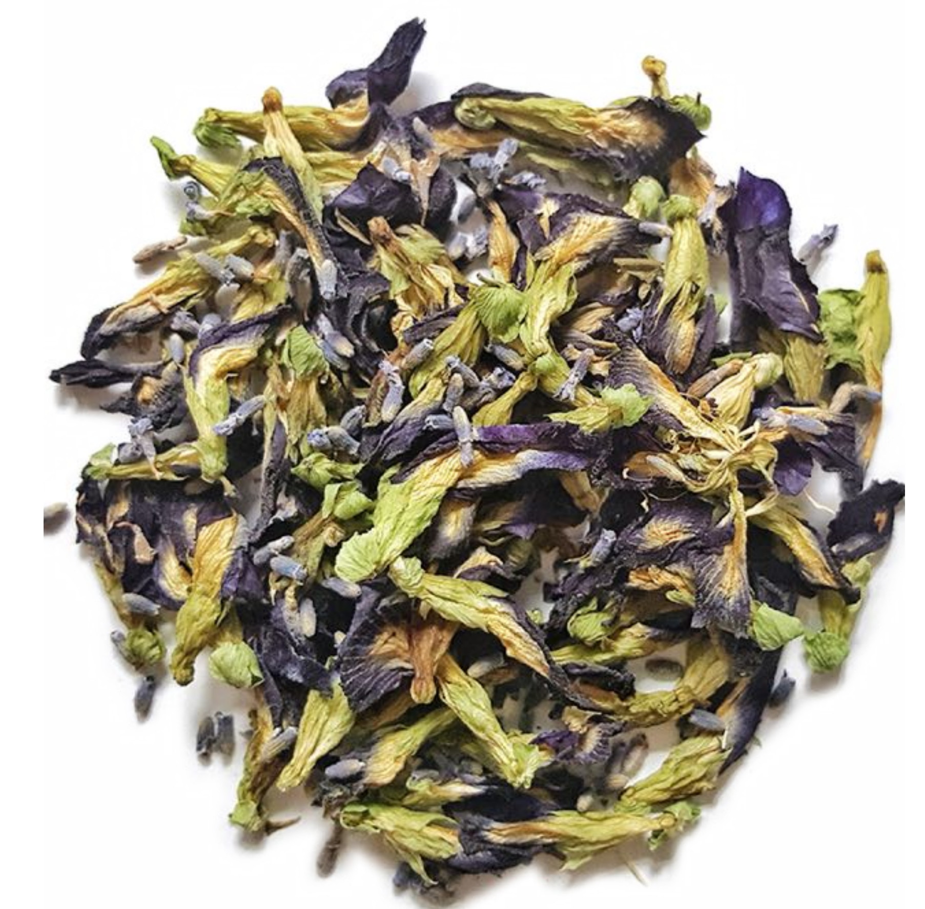
Bylinné & Ovocné čaje