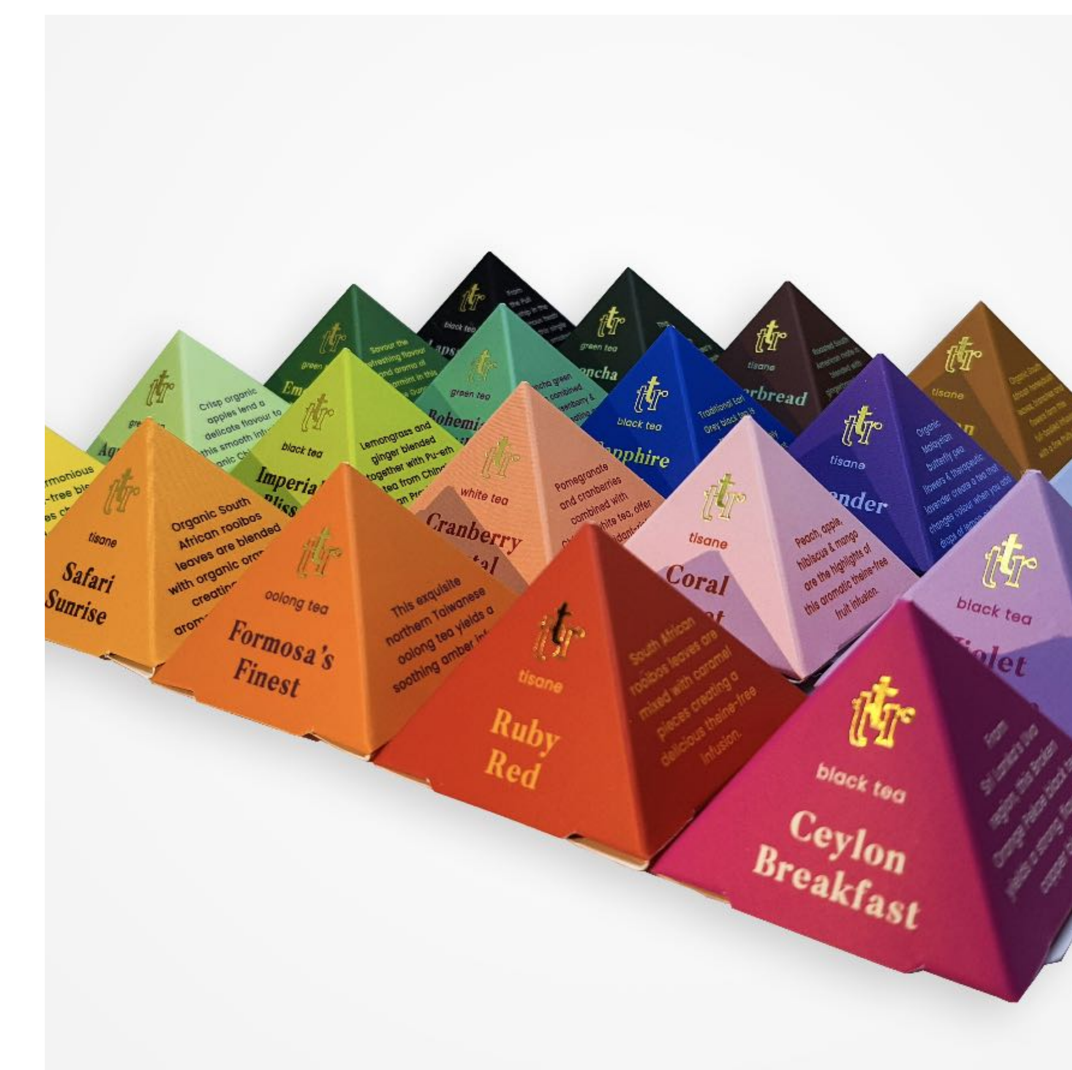
Ukázka individuálních čajových pyramid The Tea Republic