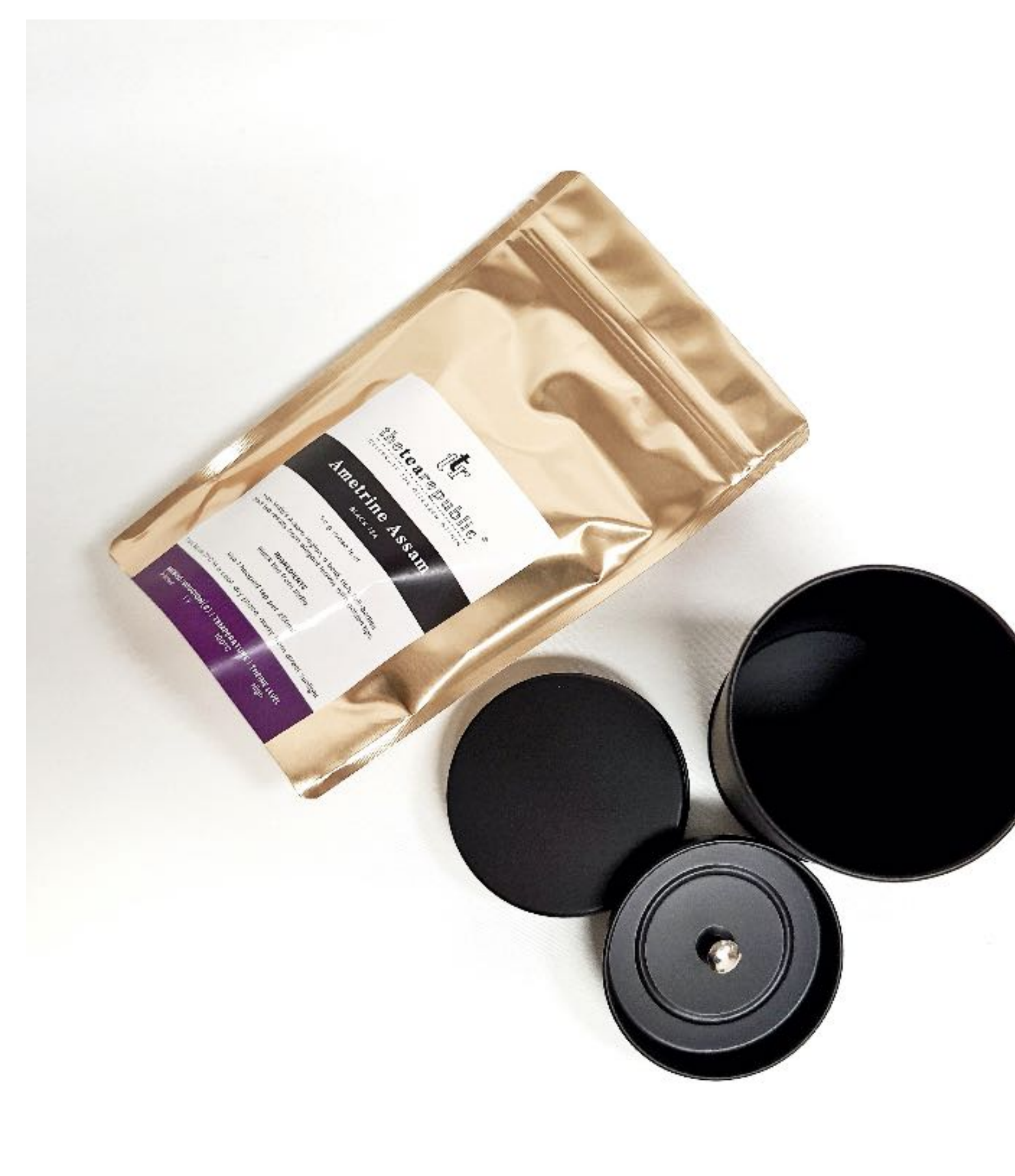
Ukázka čajového vaku a dózy The Tea Republic