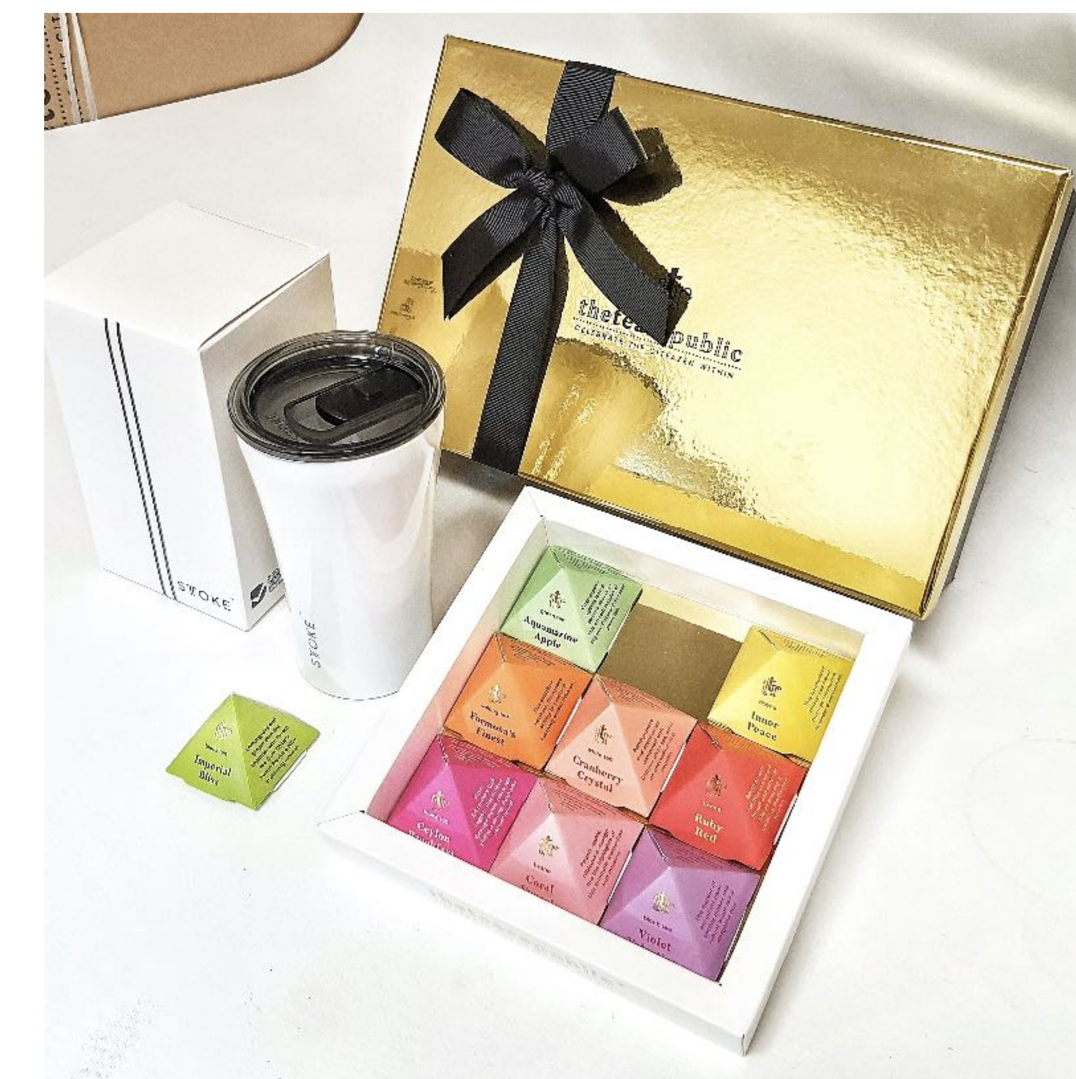
Ukázka speciální dárkové balení