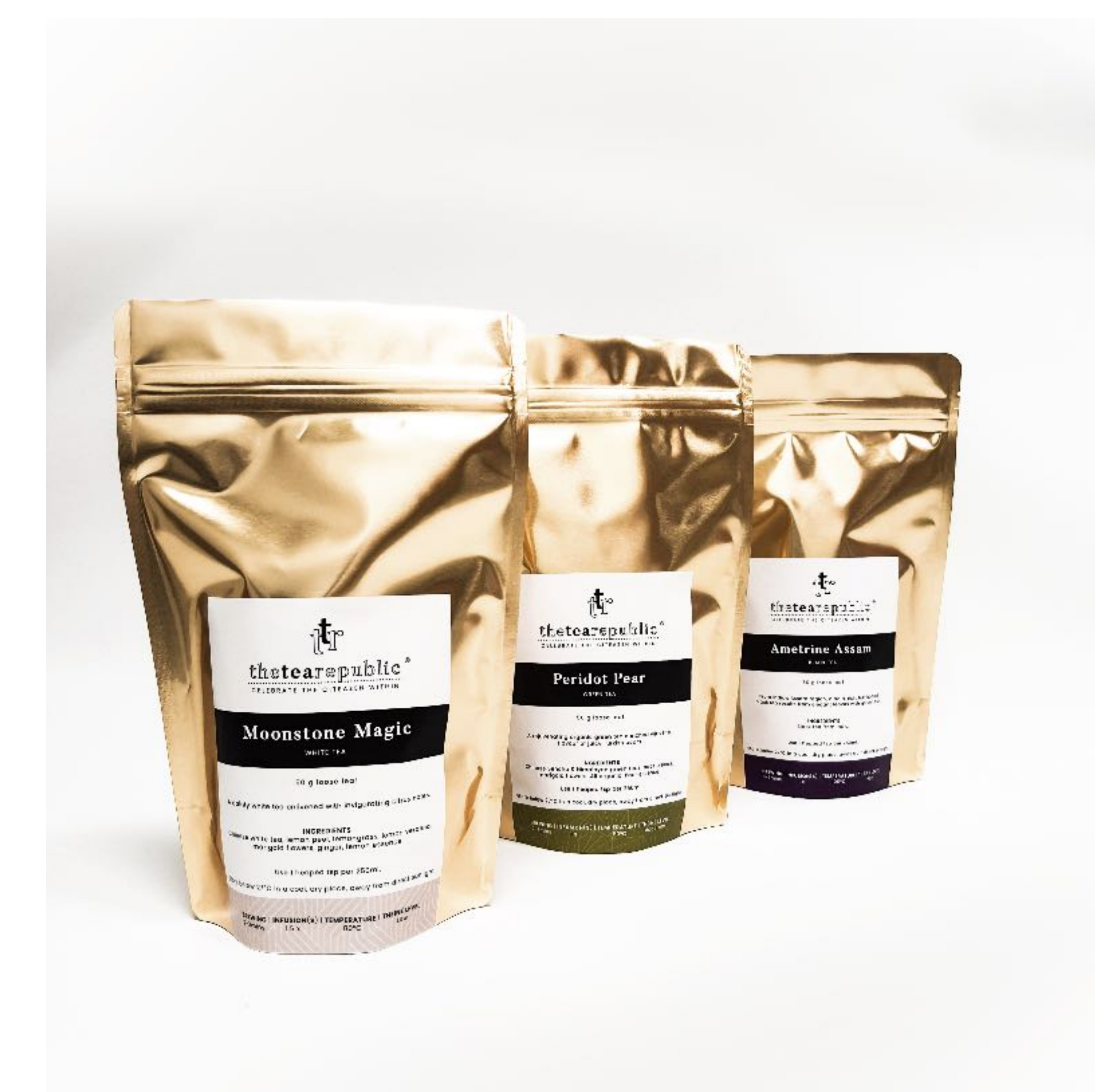
Každý vak obsahuje 50g sypaného čaje