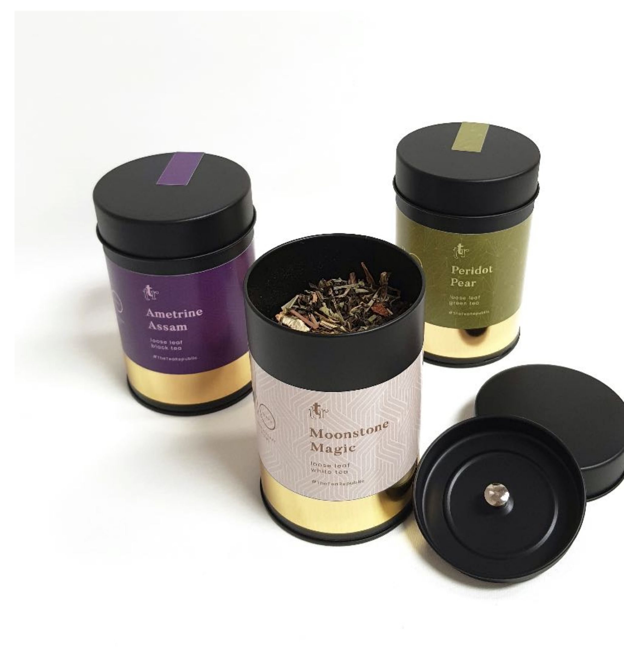
Ukázka čajových dóz The Tea Republic