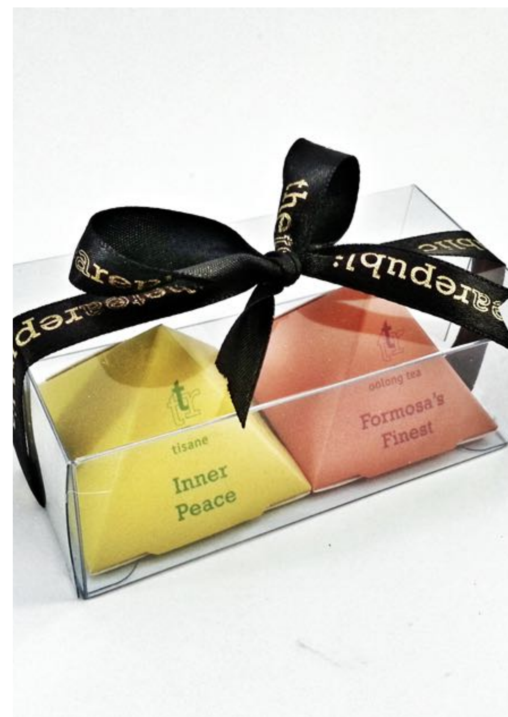
Dárkové balení pro 2