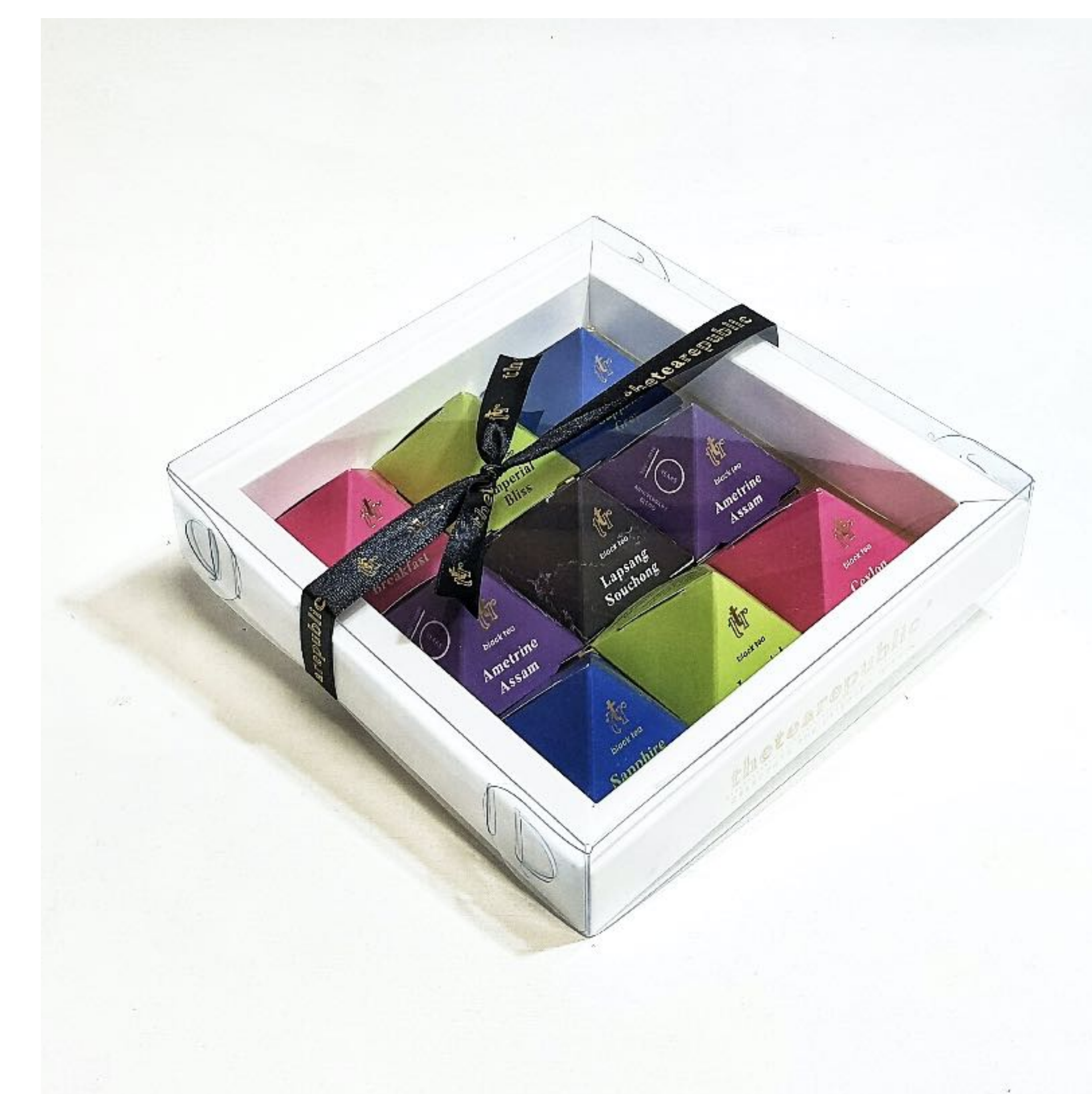
Ukázka dárkového balení černých čajů