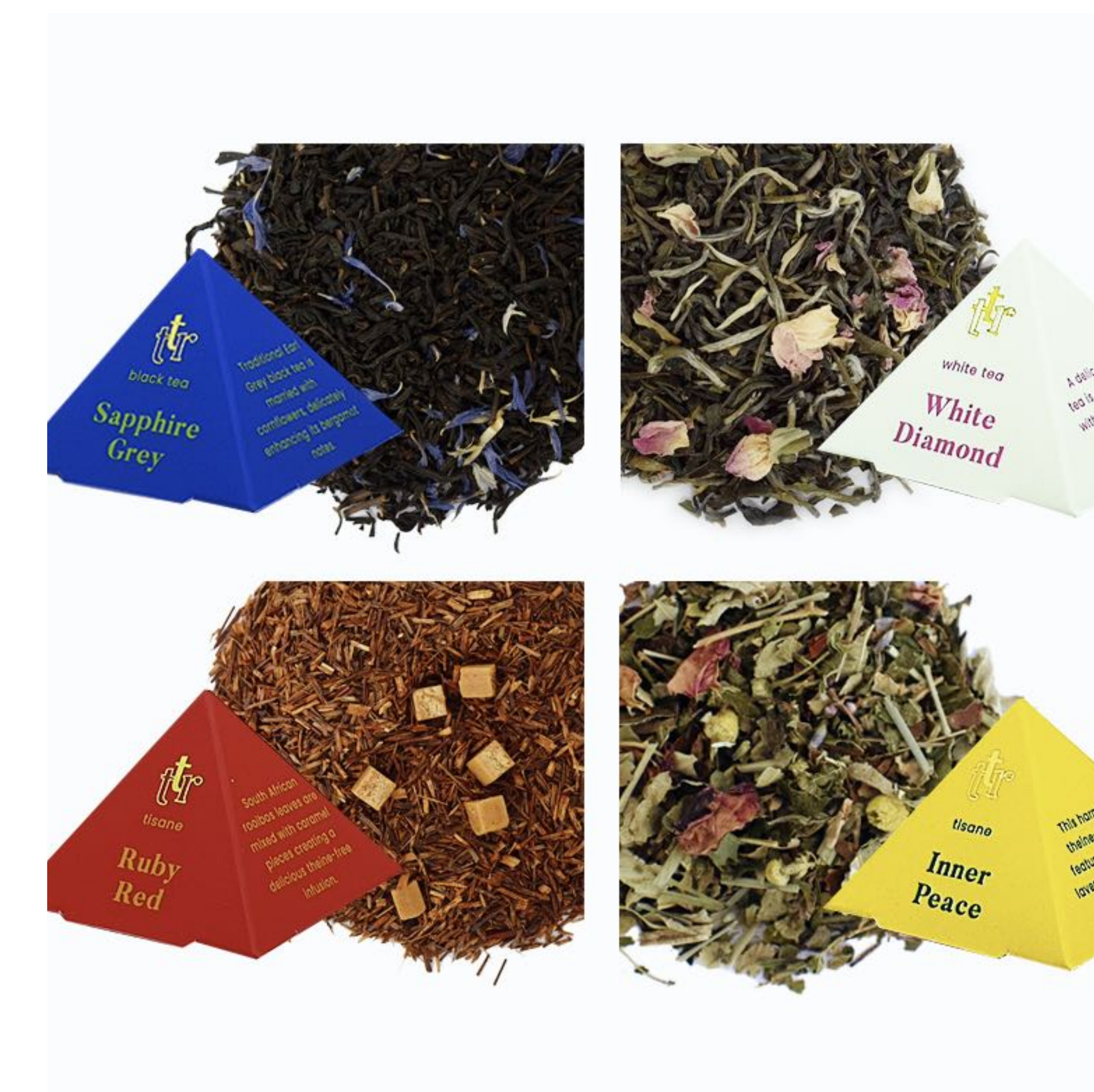
Ukázka čajů a pyramid