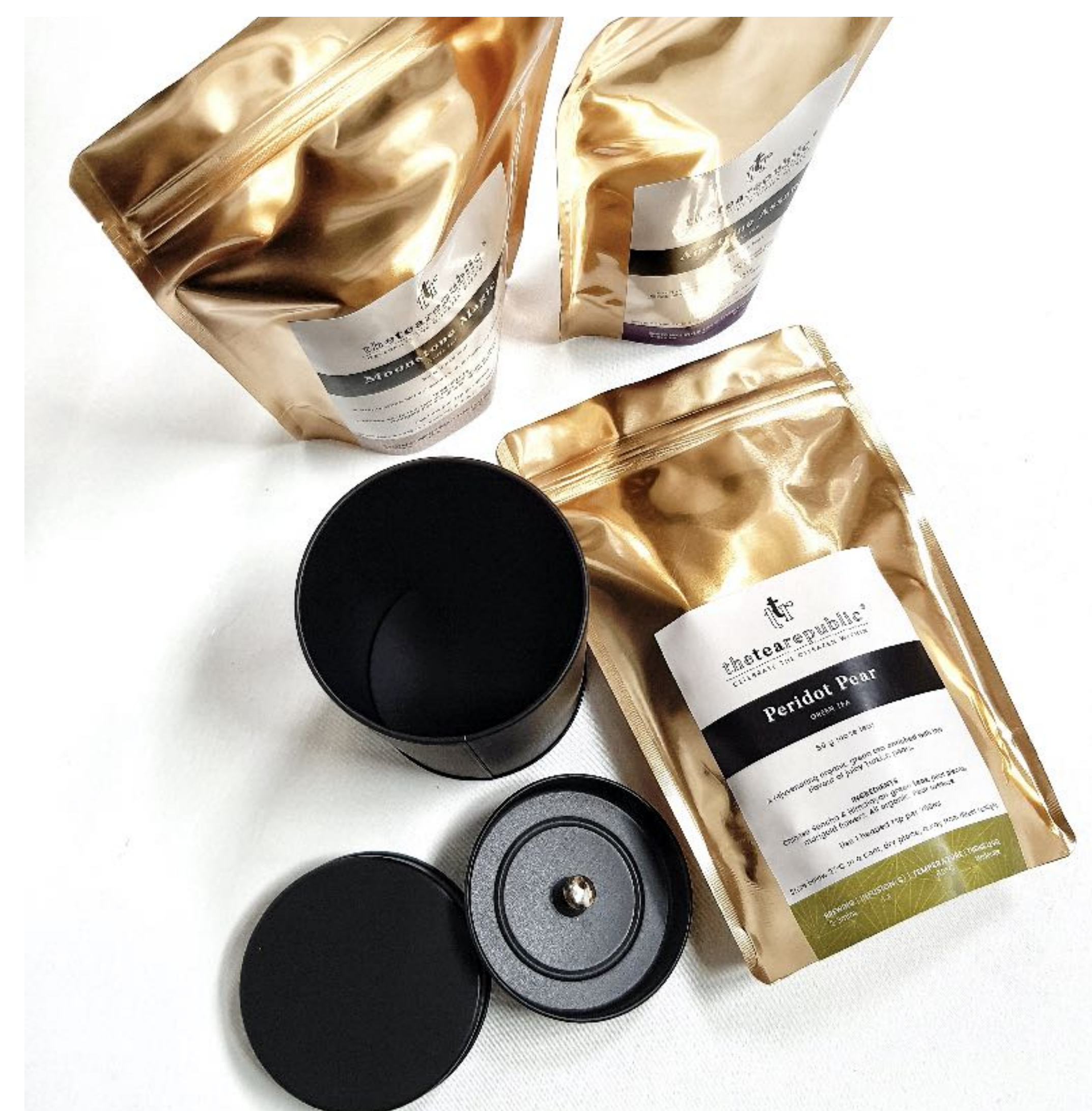
Ukázka čajových vaků a dózy The Tea Republic

Čajové vaky jsou náš neekonomičtější produkt vhodný pro ty, kteří vědí, co chtějí - nebo pro vyzkoušení něčeho nového. Produkt obsahuje až 50 g sypaného listového čaje. Z každého vaku je možné připravit přibližně 20 až 25 šálek čaje.