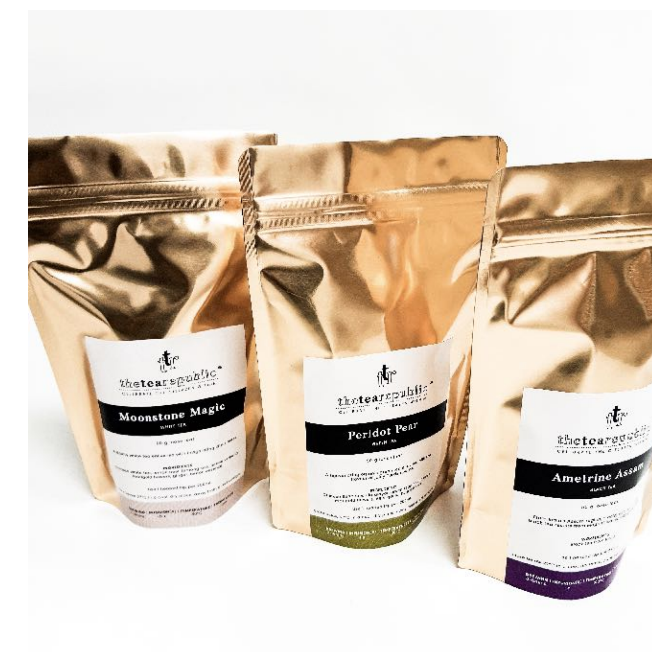
Ukázka čajových vaků The Tea Republic