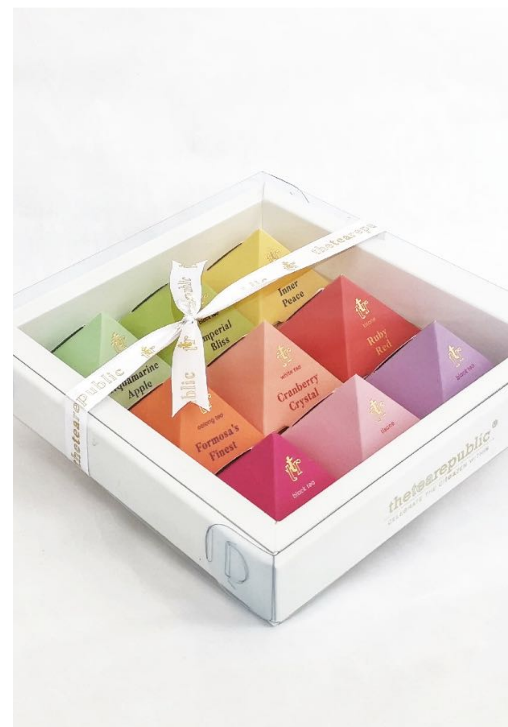
Dárkové balení “9 Pyramid”