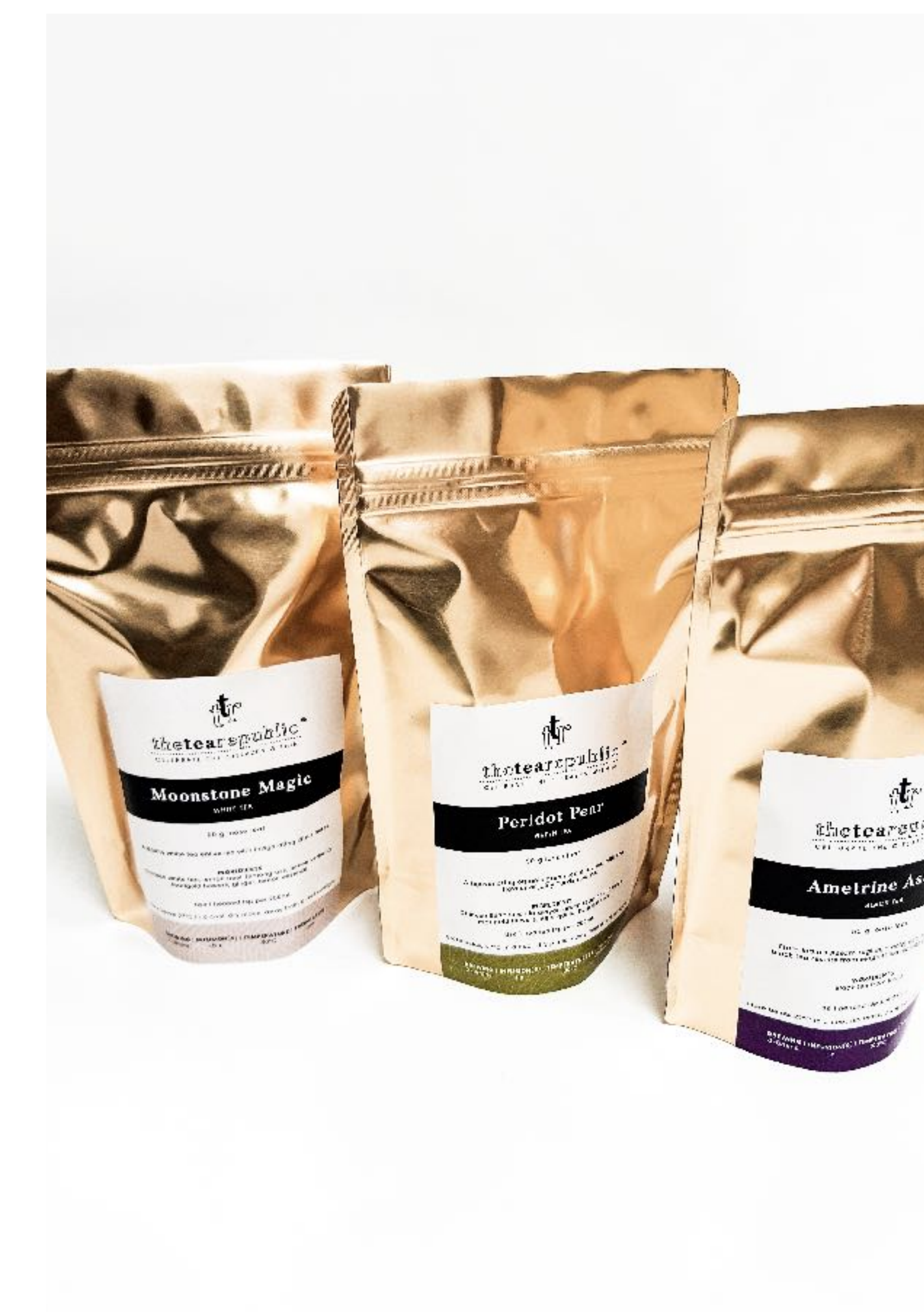
Sypaný čaj vak, 50g