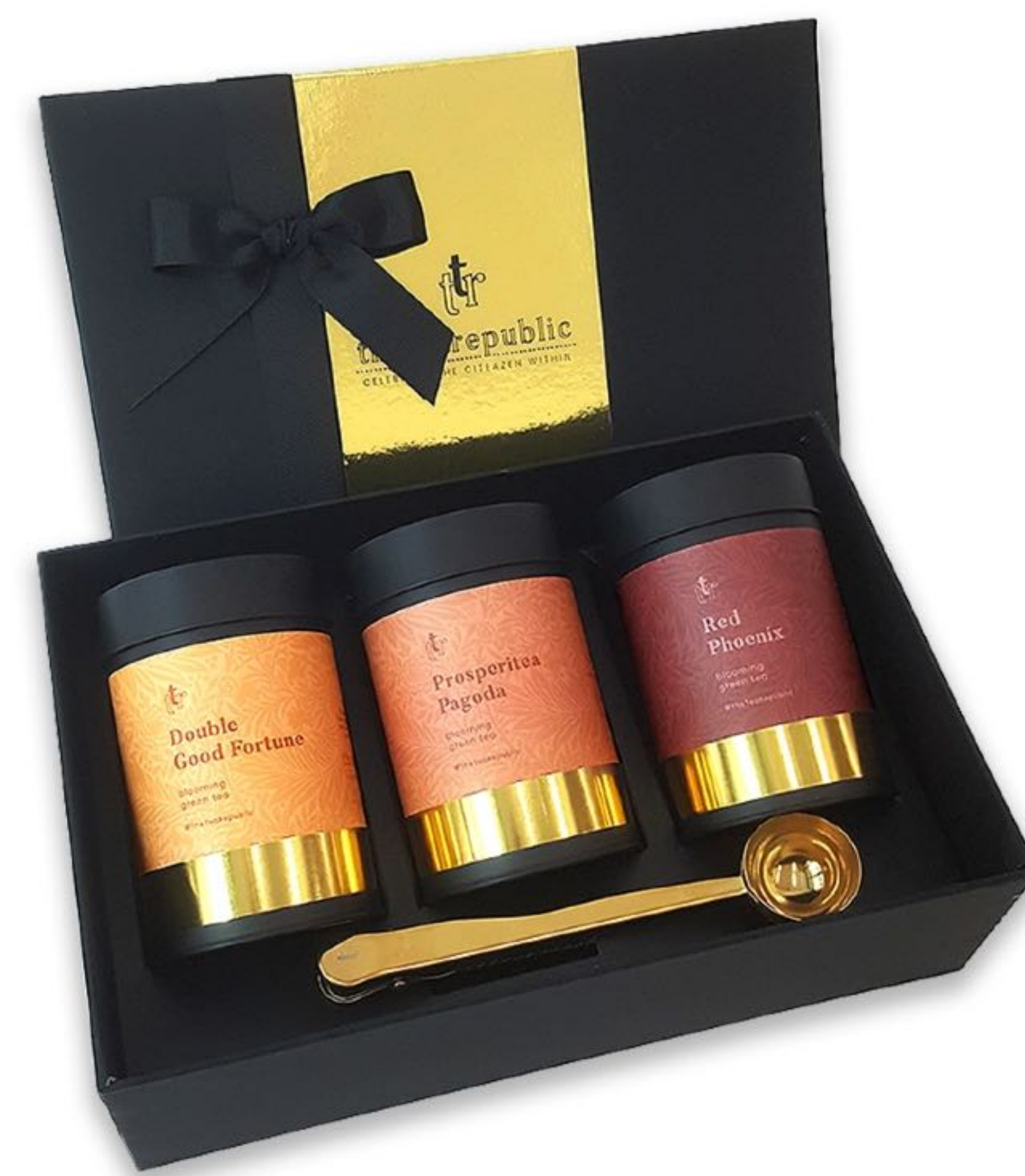
Ukázka ze speciální dárkové kolekce

Čajové dózy jsou ideálním produktem pro milovníky čaje. Produkt obsahuje až 75 g sypaného listového čaje v opakovaně použitelné nádobě. Z každé dózy je možné připravit přibližně 25 až 30 šálků čaje.