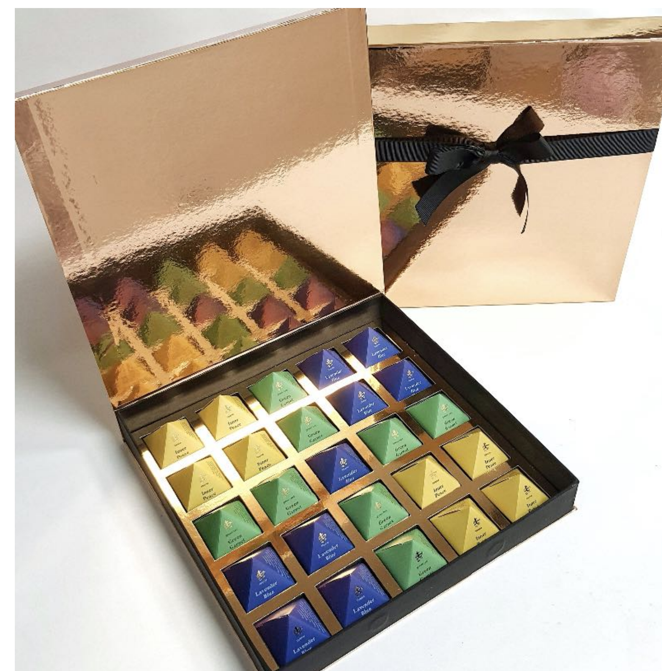
Ukázka ze speciální dárkové kolekce

Čajové pyramidy jsou náš tradiční produkt. Umožňují zákazníkům výběr z charakteristických čajových směsí The Tea Republic. Každá pyramida obsahuje 1 jednorázové organické louhovací sítko sypaných čajových lístků—vhodné pro přípravu cca 300ml čaje.