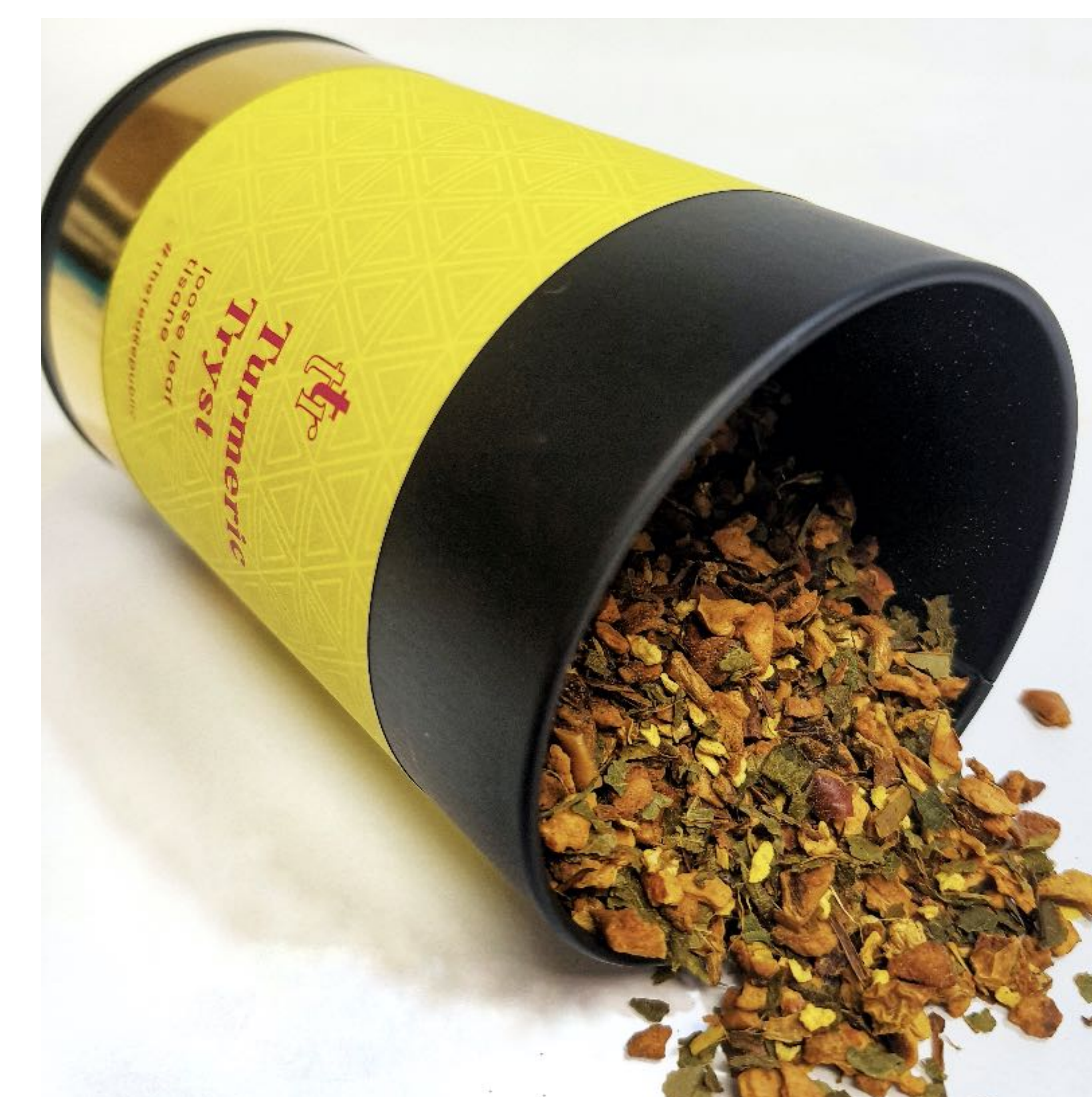
Každá dóza obsahuje 50g sypaného čaje