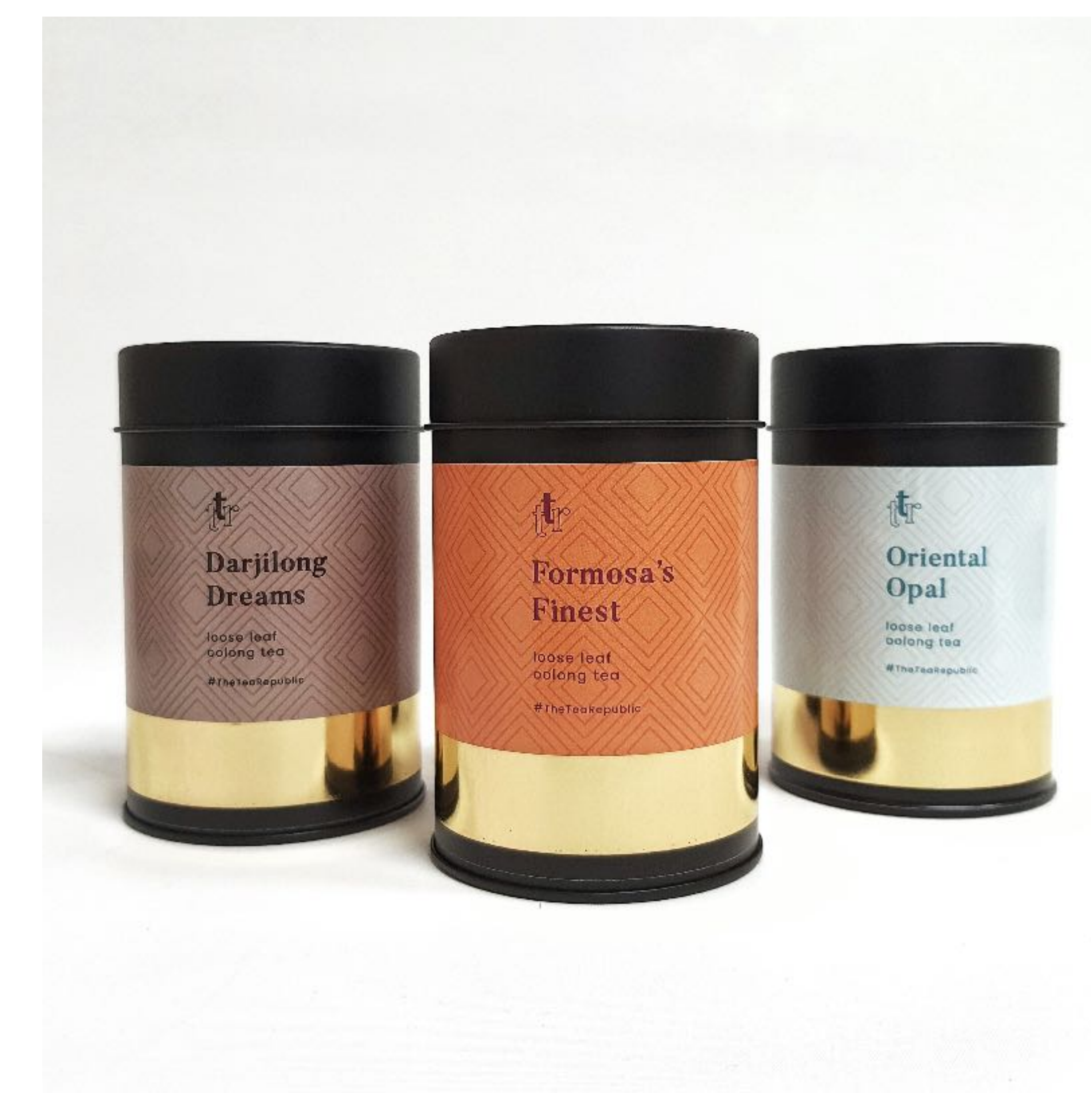
Ukázka čajových dóz The Tea Republic