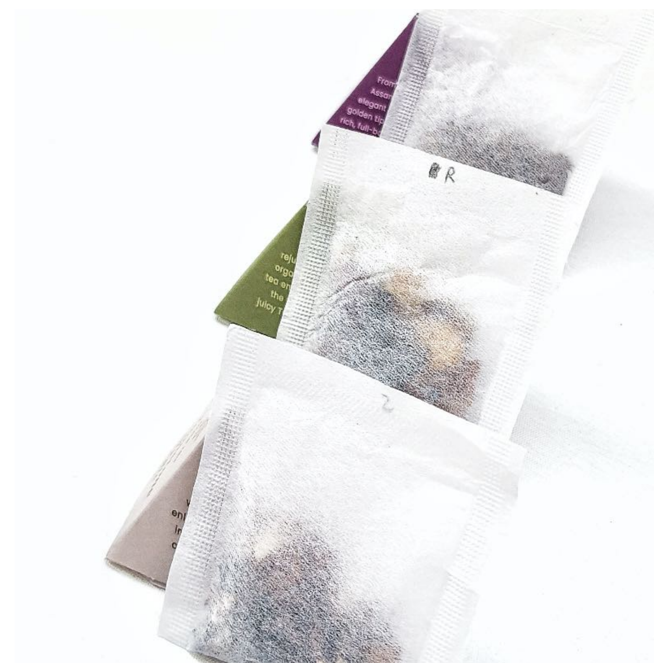
Každá pyramida obsahuje organický infuzer se sypaným čajem