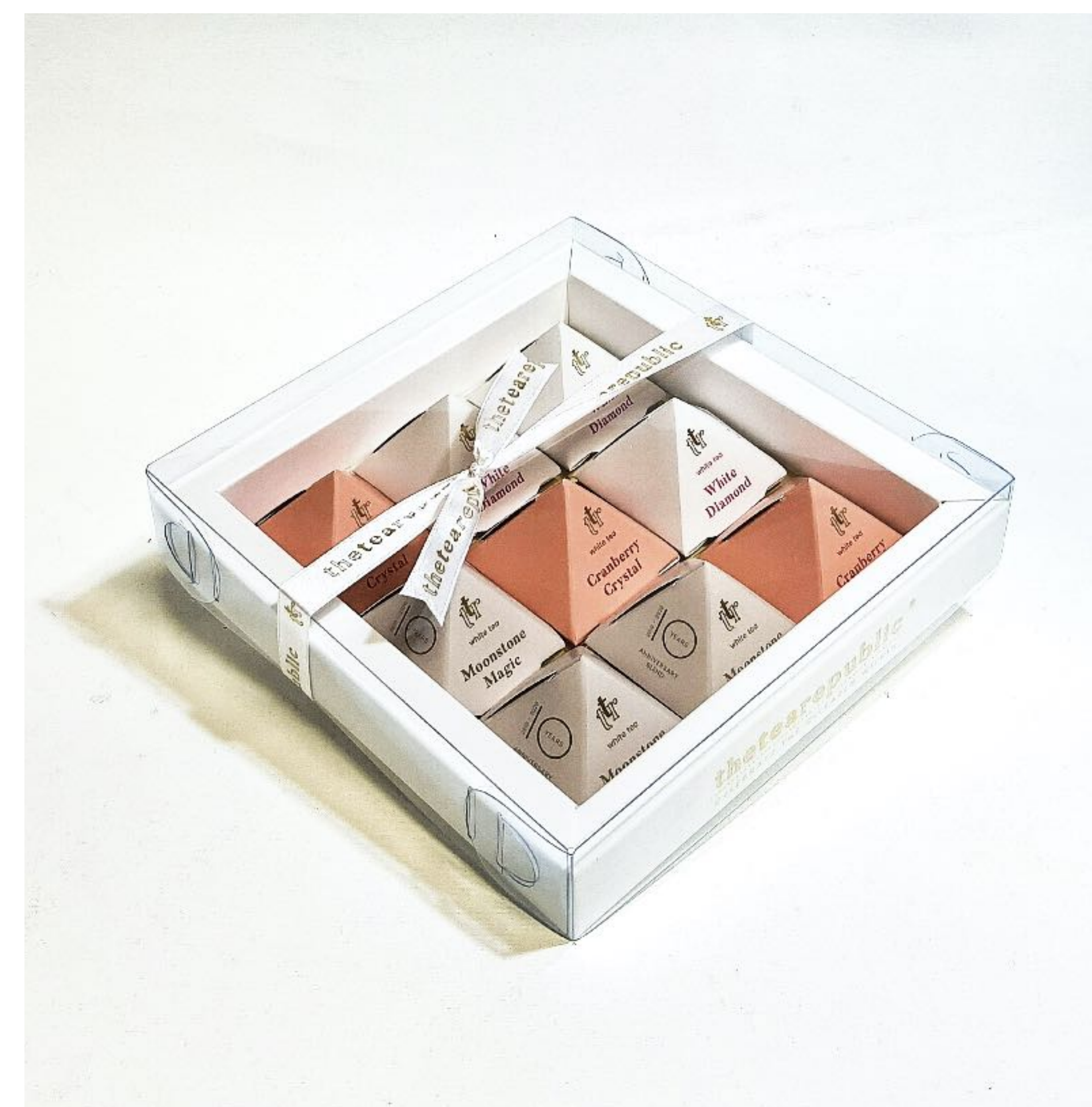
Ukázka dárkového balení bílých čajů

Náš nejprodávanější produkt. Obsahuje devět čajových pyramid, které zákazníkům nabízejí možnost zakoupit si kolekci rozmanitých pečlivě vybraných čajových směsí v jedinečných obalech. Každá pyramida obsahuje 1 jednorázové organické louhovací sítko sypaných čajových lístků—vhodné pro přípravu cca 300ml čaje.